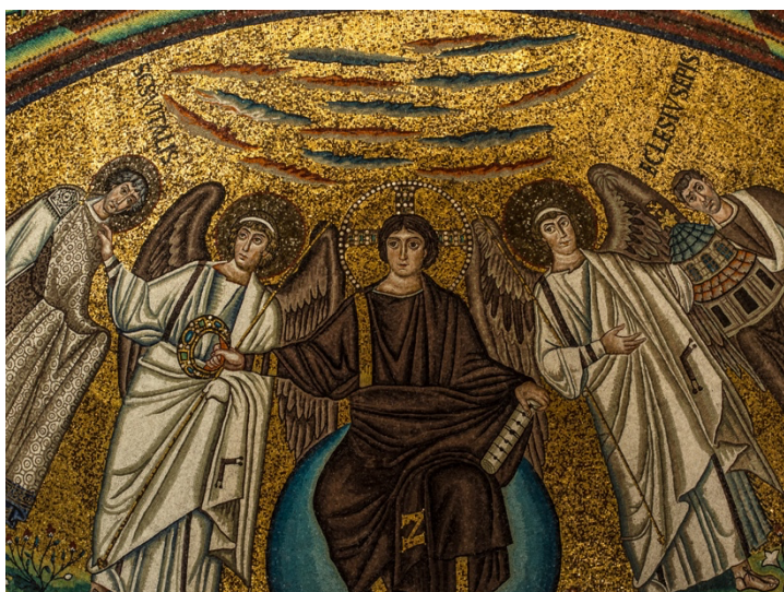
Figure senza ombra

Nell'arte bizantina l'ombra assume un valore molto particolare. Osserviamo i mosaici della Chiesa di San Vitale a Ravenna , per esempio: l'oro fa da padrone e la luce diventa la grande protagonista. E l'ombra, che fine fa? Provate a guardare bene: è sparita! Tutto sembra illuminato da una luce diffusa, come se fosse mezzogiorno e il sole fosse alto nel cielo, e le