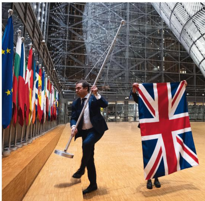
La Brexit I membri dello staff del Consiglio europeo rimuovono la bandiera del Regno Unito nel giorno dell'uscita del Paese dall'Ue (Bruxelles, 31 gennaio 2020).

Diritti e cittadinanza europea Il Trattato di Maastricht riconobbe la “ cittadinanza europea ” a ogni cittadino e cittadina in possesso della nazionalità di uno degli Stati membri, con la possibilità di esercitare diversi diritti , fra i quali la libertà di circolazione e di soggiorno, di studio e di lavoro in tutto il territorio comunitario, il diritto di voto nelle elezioni amministrative dello Stato in cui una persona sceglie di fissare la residenza e in quelle per il Parlamento europeo AGORA 2030 Cittadinanza europea, intervista a Gianfranco Pasquino , p. 358.