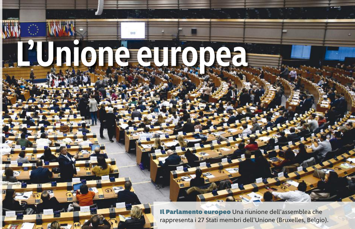
Il Parlamento europeo Una riunione dell'assemblea che rappresenta i 27 Stati membri dell'Unione (Bruxelles, Belgio).