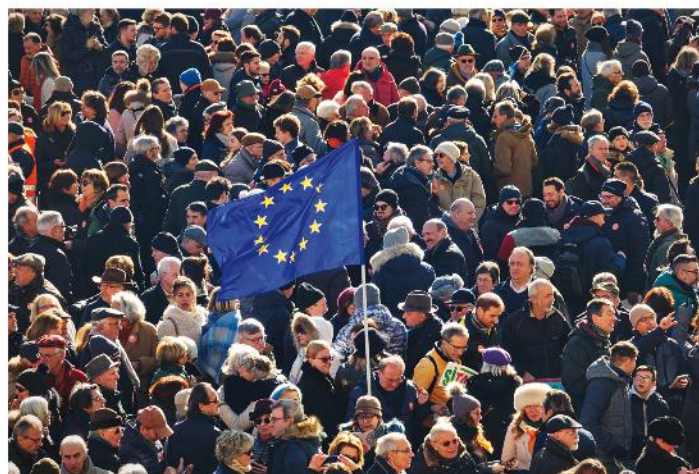
La bandiera dell'Ue Durante una manifestazione, i cittadini sventolano la bandiera dell'Ue: un cerchio di 12 stelle, simbolo di unità e armonia tra i popoli europei.

In questo periodo ci furono altre due tappe molto importanti che diedero all'Europa unita le caratteristiche che conosciamo oggi. La prima fu, nel 1985, l' Accordo di Schengen (divenuto Convenzione di Schengen), dal nome della cittadina lussemburghese dove fu sottoscritto. Esso stabilì la libertà di circolazione delle persone , senza cioè più controllo alle frontiere, fra i Paesi aderenti al cosiddetto spazio Schengen . Tale area di libera circolazione si è allargata nel tempo, arrivando a comprendere oggi 27 Stati (di cui quattro non appartenenti alla Ue). La seconda tappa fu il Trattato di Maastricht , sottoscritto nel 1992 nella cittadina olandese, che diede vita a nuova realtà politica ed economica,