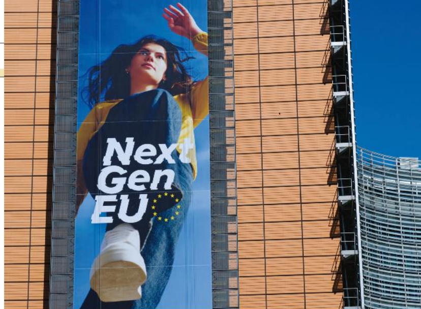
Next Gen Eu Il manifesto del progetto sul Palazzo Berlaymont a Bruxelles, sede della Commissione europea.